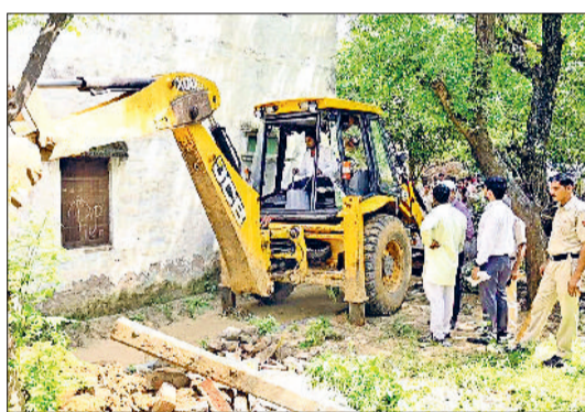
मंडी अटेली। पीले पत्रों की सहायता से अवैध कब्जे हटाते हुए।