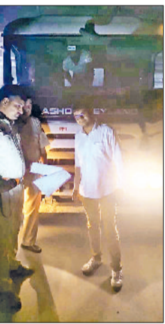
नारनौल। खनिज की अवैध दुलाई करते पकड़े गए वाहन।

इस अभियान के तहत अगस्त से लेकर नौ सितंबर तक कुल 101 वाहनों को जब्त किया गया है। यह कार्रवाई लगातार जारी है। इसी क्रम में 10 सितंबर को तीन डंपर और एक ट्रैक्टर ट्रॉली को पकड़ा गया। इसके अतिरिक्त वीरवार सुबह भी तीन डंपरों को जब्त किया गया। विभाग ने स्पष्ट किया है कि जब्त