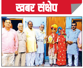
नारनौल। छात्रा को सम्मानित करते सभा के सदस्य।