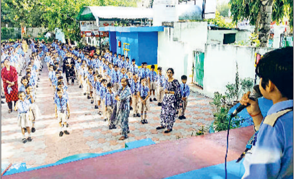
महेंद्रगढ़। कार्यक्रम में अपनी प्रस्तुति देते विद्यार्थी।