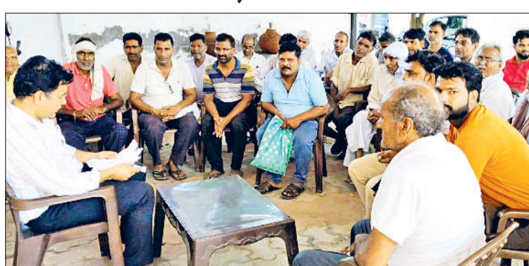
मंडी अटेली। मंत्री के पीए से बातचीत करते दुकानदार।

रेहड़ी-खोखा संचालकों ने कहा कि अगर उनके आजीविका के साधन हटा दिए गए तो उनके परिवार भूखमरी की कगार पर आ जाएंगे। बच्चों की पढ़ाई और गुजारा टप हो जाएगा। इस पर मंत्री के पीए ने उन्हें आश्वासन दिया कि गरीबों को दिक्कत नहीं आने दी