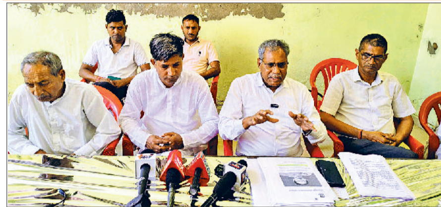
मंडी अटेली। पत्रकारवार्ता को संबोधित करते अस्पताल बनाओ संघर्ष समिति के सदस्य।

लिए वॉटर वर्क्स के लिए देने को कहा था। ग्राम सभा भगवानपुर ने 10 एकड़ जमीन वाटर वर्क्स के लिए राव इंद्रजीत सिंह के कहने पर दे दी और सात एकड़ सात कनाल नौ मरला जमीन हॉस्पिटल के लिए सरकार को फ्री में दे दी। 10 एकड़ जमीन की वाटर वर्क्स के लिए सरकार को दे दी और सरकार के नाम रजिस्ट्री भी करा दी गई, परंतु हॉस्पिटल के लिए राव इंद्रजीत सिंह एवं स्वास्थ्य मंत्री ने इनकार कर दिया। जबकि एक्सपर्ट की रिपोर्ट के अनुसार भगवानपुर की जमीन शहर के साथ एवं एनएच 71 के साथ होने की वजह से हर तरह से उपयुक्त है। सरकार के अधिकारियों ने खुद इसे अपनी रिपोर्ट में माना है। स्वास्थ्य मंत्री हरियाणा सरकार की चुपके चुपके एक पत्र जारी होने से जनता को चौका दिया, जब उस पत्र में उन्होंने संबंधित बीडीपीओ को हॉस्पिटल के लिए शाहबाजपुर खालसा की जमीन का प्रस्ताव पास करवाने का आदेश दे दिया। इससे विशुभ होकर