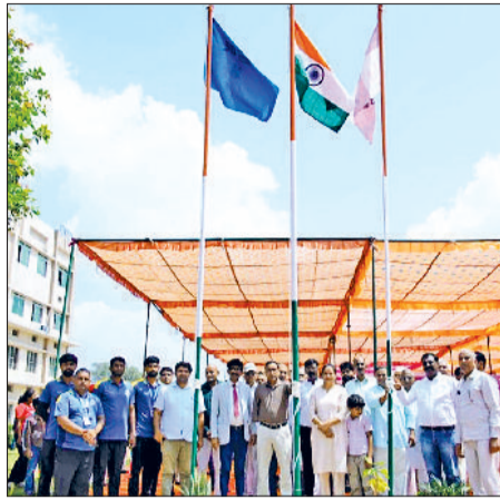
कनीना। ध्वज फहराकर बॉक्सिंग प्रतियोगिता का शुभारंभ करते मुख्य अतिथि। व खेलों में हिस्सा लेते मक्केबाज।