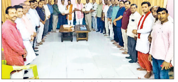
नारनौल। रैली के लिए जनसमर्पक करते इनेलो कार्यकर्ता।