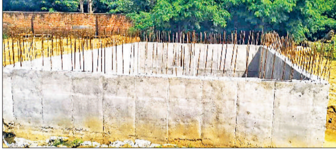
महेंद्रगढ़। विभाग द्वारा बनाए रहे बूस्टिंग स्टेशन।

बता दें कि जनस्वास्थ्य विभाग की ओर से मई 2024 में तीनों टैंकों का एस्टीमेट बनाकर उच्च अधिकारियों को भेजा गया था। स्वीकृति मिलते ही टेंडर प्रक्रिया शुरू