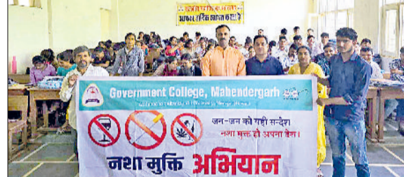
महेंद्रगढ़। कार्यक्रम में उपस्थित विद्यार्थी व स्टॉफ सदस्य।