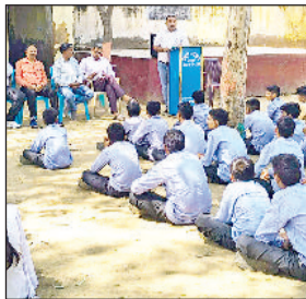
मंडी अटेली। विद्यार्थियों को जैव विविधता के बारे में जानकारी देते हुए।