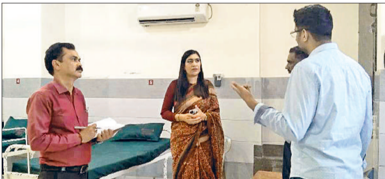
नारनौल। नशा मुक्ति केंद्र का निरीक्षण करती सीजेएम नीलम कुमारी।

जिला विधिक सेवा प्राधिकरण की सचिव एवं मुख्य न्यायिक दंडाधिकारी नीलम कुमारी ने वीरवार को समाज कल्याण से जुड़े चार महत्वपूर्ण केंद्रों का दौरा किया। इस दौरे का उद्देश्य इन केंद्रों के कामकाज का निरीक्षण करना और जरूरतमंद लोगों को दी जा रही सुविधाओं का जायजा लेना था। उन्होंने संबंधित अधिकारियों से बातचीत की और आवश्यक दिशानिर्देश दिए। सीजेएम नीलम कुमारी ने सबसे पहले नागरिक अस्पताल में स्थित नशा मुक्ति केंद्र का दौरा किया। उन्होंने कहा कि नशा मुक्ति केंद्र समाज में एक महत्वपूर्ण भूमिका निभाते हैं, क्योंकि ये व्यक्तियों को नशा मुक्त होने में मदद करते हैं। उन्होंने श्री माधव कल्याण समाज ट्रस्ट में स्थित नशा मुक्ति केंद्र का भी दौरा किया, जहां उन्होंने और बेहतर सुविधाएं प्रदान करने के लिए सुझाव दिए। इसके बाद सीजेएम ने सेफ हाउस का निरीक्षण किया। उन्होंने कहा कि सेफ हाउस का उपयोग उन लोगों के लिए किया जाता है, जिन्हें तत्काल सुरक्षा की आवश्यकता होती है। उन्होंने